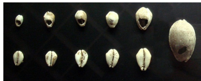
表2. 中国的贝壳钱币

从公元前 1200 年到公元前 50 年，世界各地出现了货币，但是那时的货币同今天的货币是不一样的。古代中国人使用一种贝壳做的贝壳钱币以及金属钱币，土著印第安人则使用打磨过的火山石作为钱币。