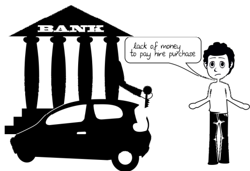
表 4. 由于无法按时付汽车贷款，银行将汽车收回

人们之所以陷入财务上的困境是因为在他们成长的过程中，人们没学会了解理财的基本原理，学校也没有提供给他们合理理财所需要的知识。而这