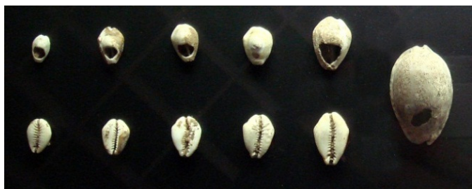
表二：公元前 16-18 世纪中国贝币

问题还是出现了。作为货币媒介的物品不容易分割（无法找零）。还有就是货币的种类太多，无法进行统一交易。